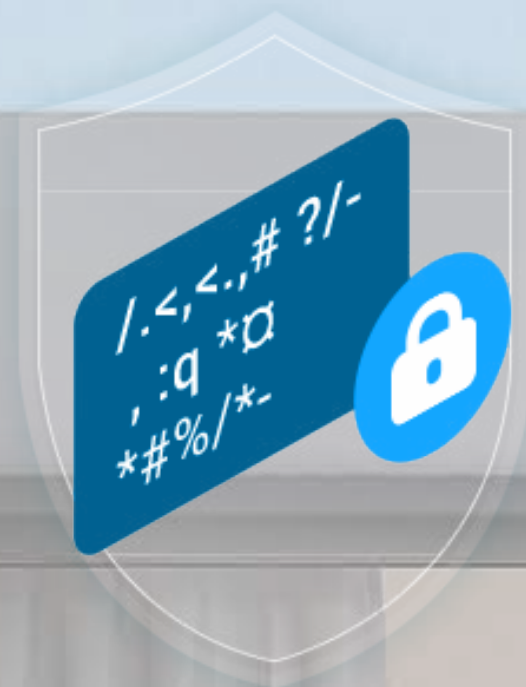
AES 128-Bit-Verschlüs- selung

Der Schutz Ihrer Daten und Privatsphäre hat für uns oberste Priorität. Die Datenübertragung zwischen dem Gerät und der EZVIZ-Cloud ist lückenlos verschlüsselt. Nur Sie haben die Schlüssel um Ihre Daten zu entschlüsseln.