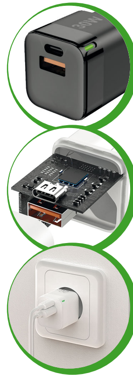
Art. Nr.: 261367