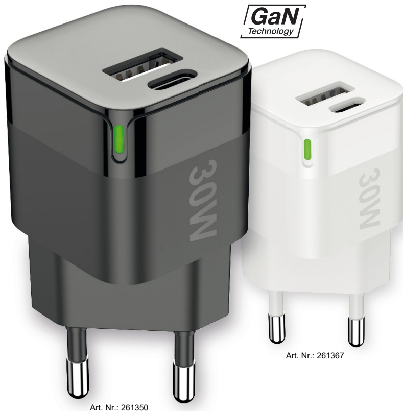
Art. Nr.: 261350