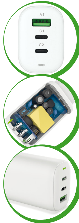
Art. Nr.: 260728