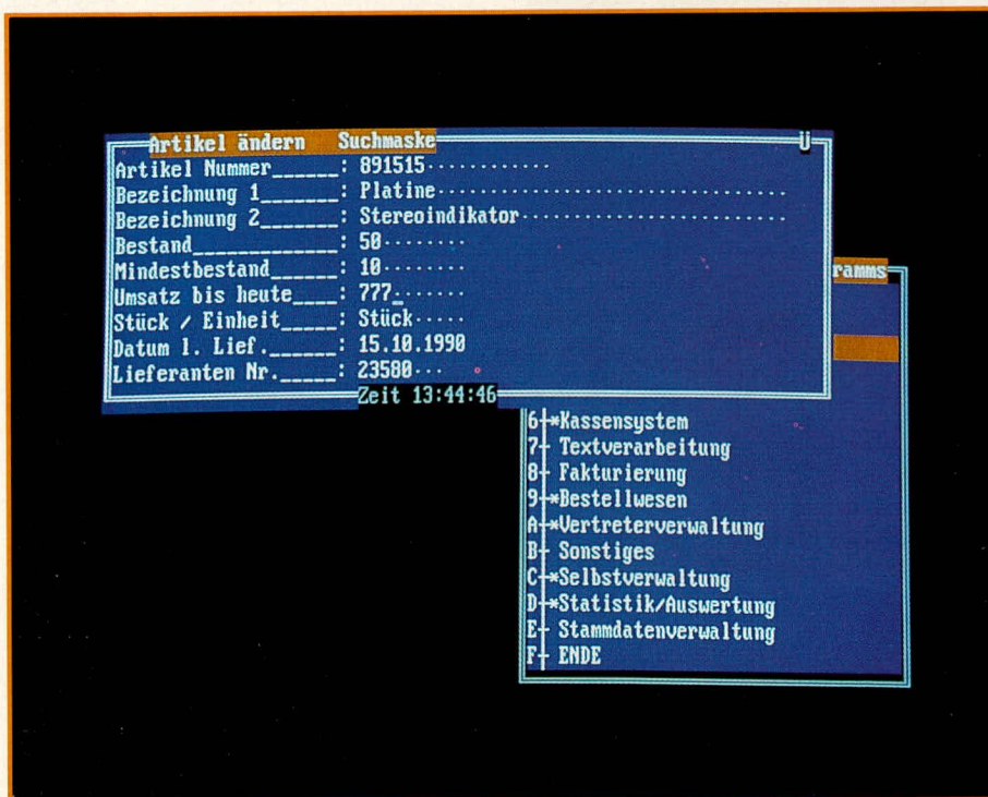
Bild 1: Bildschirm-Eingabemaske der Artikelverwaltung in ELV MASTER, aufgeblendet über Hauptmenü. Bis zu 2.000.000 derartiger Datensätze werden vom Programm verwaltet.

- Bankverwaltung für die Belegeingabe von bis zu 8 unterschiedlichen Banken;