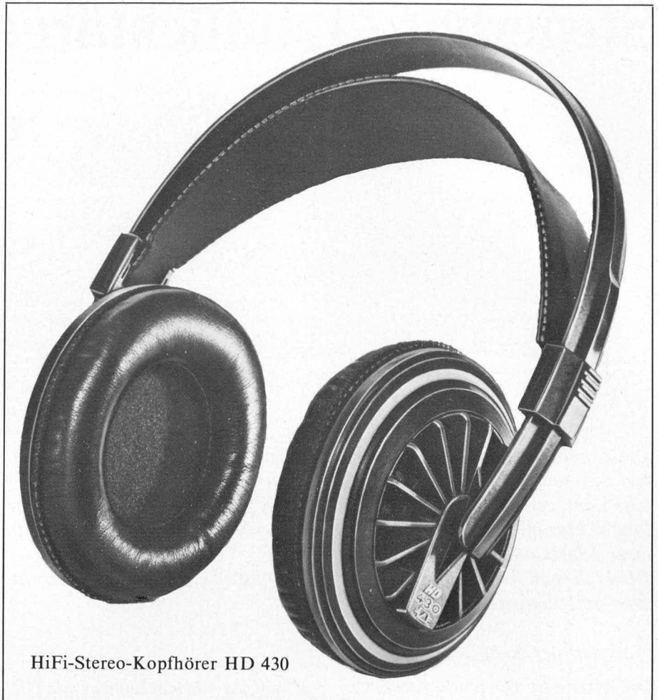
HiFi-Stereo-Kopfhörer HD 430

Eine weitere Maßnahme zur Verbesserung des offenen Hörerprinzips besteht in der exakten Anpassung des Raumes zwischen dem Ohr und der transparenten Membran an das äußere Schallfeld. Im ersten Moment erscheint bei oberflächlicher Betrachtung der HD 430 aufgrund seines ringförmigen Ohrpolsters wie ein Kopfhörer der geschlossenen Bauweise. Sieht man sich den Hörer jedoch ge-