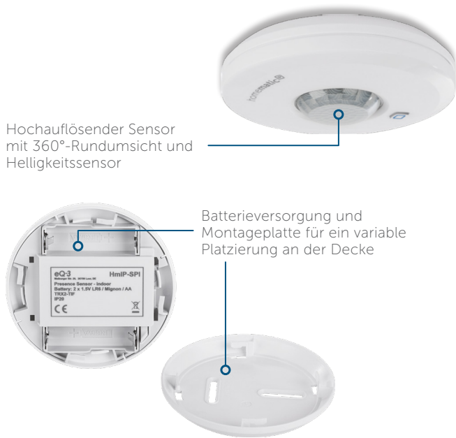
Hochauflösender Sensor mit 360°-Rundumsicht und Helligkeitssensor