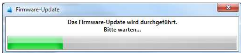
Abbildung 2: Die Fortschrittsanzeige des Firmware-Updates

Nach dem Bestätigen startet das TFD500 neu, befindet sich im Programmiermodus und beginnt automatisch mit der Übertragung des Firmware-Updates. Durch eine Fortschritts-Anzeige wird der Updateverlauf dargestellt. Bitte beachten Sie, dass während der aktiven Übertragung einer Firmwaredatei, die Spannungsversorgung und die USB-Verbindung nicht unterbrochen werden.