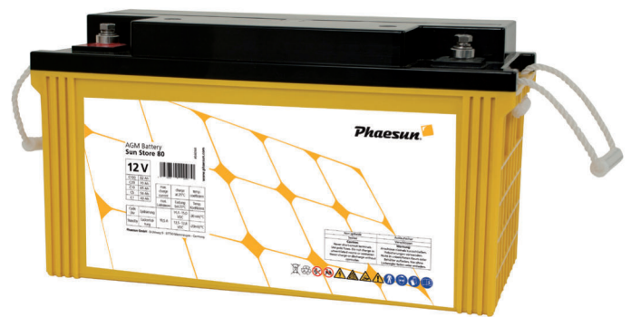
Sun Store 80

Die Phaesun Sun Store AGM Batterien sind sehr robust, wasserdicht, zyklusfest und haben eine lange Lebensdauer. Sie sind sehr effizient und am besten als Allround-Batterien geeignet.