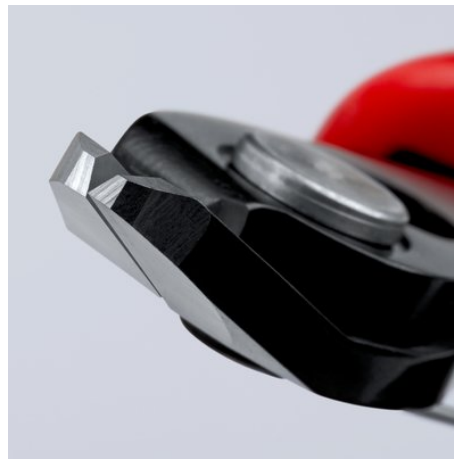
Scherschnitt mit kontrolliertem Micro-Schneidkantenversatz für lange Lebensdauer und ultrapräzisen Schnitt auch dünner Drähte