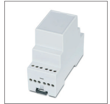
Abm. (H/B/T): 35/71/90