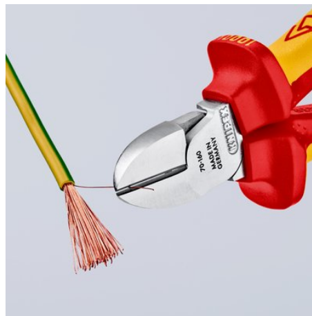
sauberer Schnitt bei dünnen Cu-Drähten, auch an den Schneidenspitzen